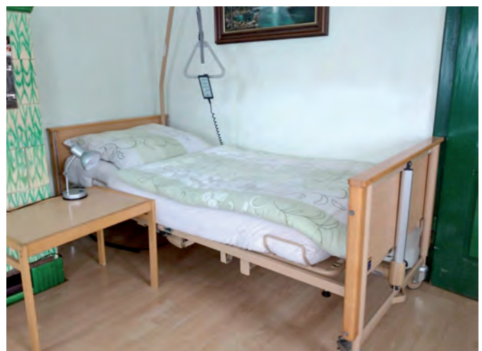
Krankenbetten stehen für pflegebedürftige Menschen kostenlos zur Verfügung