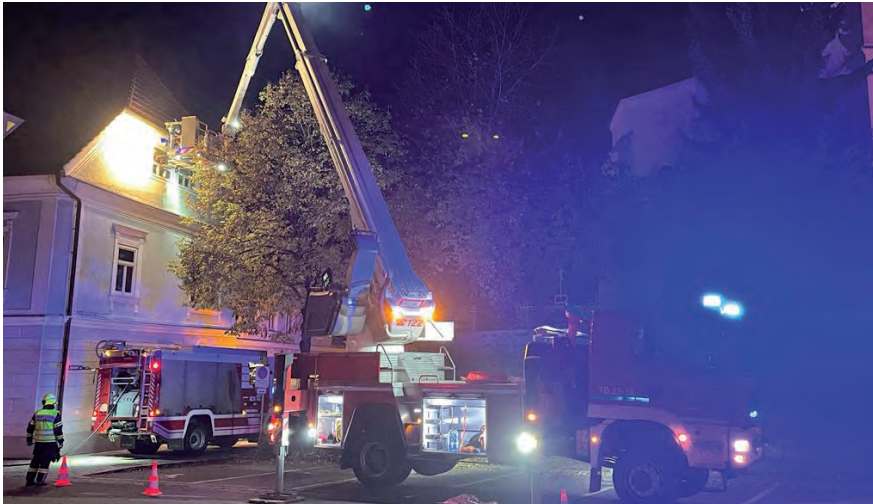
Die Feuerwehren retteten bei der Übung eine Person über ein Fenster aus dem 2. Stock

schule Raab mit mehreren vermissten Personen. Um die Personenrettung durchführen zu können, war die Teleskopmastbühne der FF Andorf im Einsatz, um eine Person mit Verdacht auf eine Wirbelsäulenverletzung zu retten.