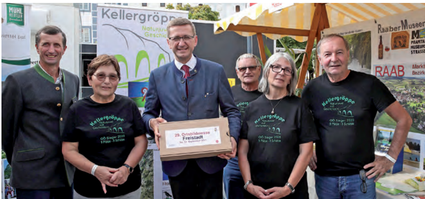
Ein Team des Vereins Raaber Museen präsentierte bei der Ortsbildmesse in Freistadt unsere Gemeinde