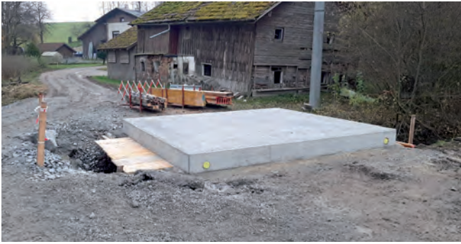
Über den Ritzinger Bach wurde ein kleines Brückenbauwerk errichtet

Nur ganz vereinzelt gibt es in Raab noch Liegenschaften, die nicht durch eine zeitgemäße öffentliche Zufahrtsstraße aufgeschlossen sind – so etwa in Krennhof. Durch den Neubau eines Güterweges wird sich dies nun ändern.