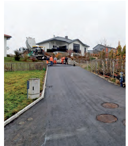
Die Firma Swietelsky bei der Asphaltierung am Ahornweg

Die im Jahr 2013 im Rohbau errichtete Straße wurde im heurigen November nun endlich asphaltiert. Dazu wurden im Vorfeld noch das letzte Straßenteilstück Richtung Hirschdobl und eine Straßenentwässerung im gesamten Verlauf samt Randleisten auf der wasserführenden Seite durch den Bauhof der Gemeinde errichtet.