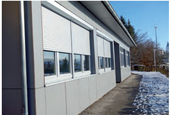
... wurden durch Vorsatzrollläden ausgetauscht