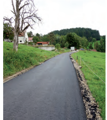
Der sanierte Güterweg in Riedlhof – im Hintergrund die Liegenschaft Rotmayr

Zudem wurde vor den Asphaltierungsarbeiten die Entwässerung des Güterweges instandgesetzt und verbessert.