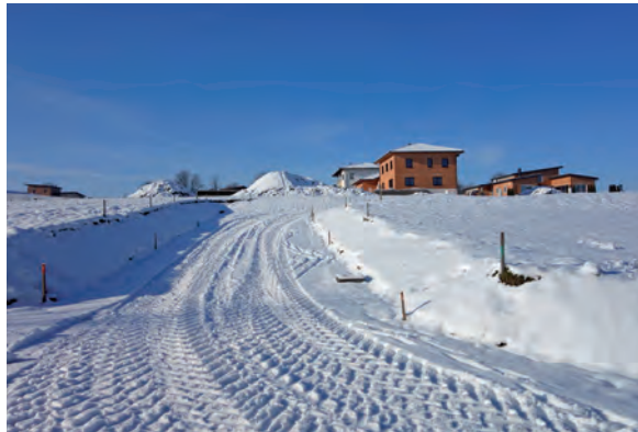
Unter einer Schneedecke verborgen die neue Siedlungsstraße