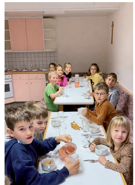
Den Kindern aus St. Willibald schmeckt das Essen aus der Raaber Schulküche bestens

Seit Beginn des heurigen Schuljahres wird in der Volksschule St. Willibald eine Nachmittagsbetreuung angeboten. Damit ist auch verbunden, ein warmes Mittagessen für die Nachmittagskinder bereitzustellen. Auf der Suche nach einer diesbezüglichen Lösung ist unsere Nachbargemeinde St. Willibald dem Beispiel der Gemeinde Enzenkirchen gefolgt. Diese bezieht bereits seit einem Jahr das Mittagessen für Kindergarten und Volksschule aus der Raaber Schulküche. In Zeiten sinkender Kinderzahlen aufgrund der demografischen Entwicklung waren die Kapazitäten in der Raaber Schulküche ohne weiteren Personalbedarf gegeben. Pro Woche werden nun 25 Portionen von der Gemeinde St. Willibald abgeholt. Das bedeutet rund 950 Portionen pro Schuljahr.