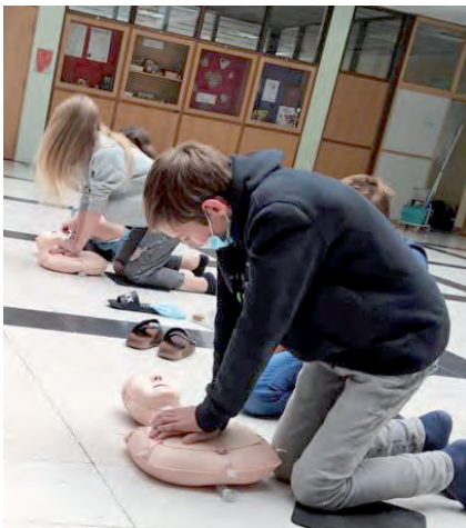
Die Schüler werden bestens zum Thema Erste-Hilfe vorbereitet

Bereits zum dritten Mal fand am 16. Oktober der „World Restart a Heart Day“ statt und natürlich nahm die Mittelschule als „Erste-Hilfe-FIT“-Schule daran teil. Ziel ist es dabei, so viele Wiederbelebungen wie möglich auszuführen. Gemeinsam führten Schüler sowie Lehrperso-