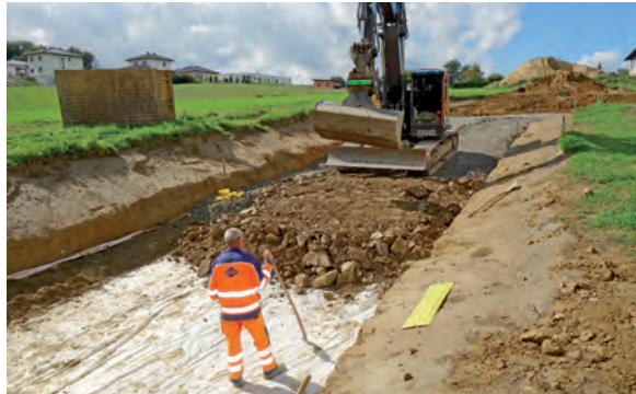
Die Firma Swietelsky bei den Straßenbauarbeiten

Insgesamt wurden acht Baugrundstücke aufgeschlossen, wovon drei bereits verkauft sind und eines davon bebaut ist.