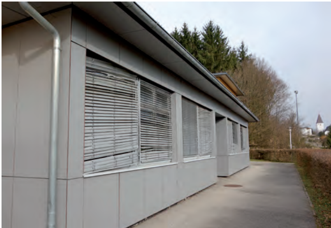
Die bereits stark zerstörten Raffstores in der Mittelschule...

Rund 5.000,00€ musste die Gemeinde dafür aufwenden.